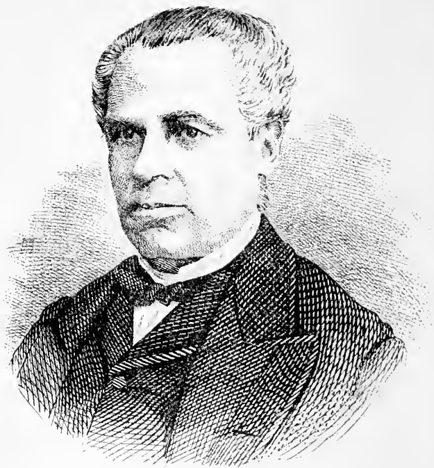
SIR GEORGE-ETIENNE CARTIER.